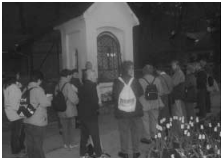
Die Wallfahrer vor dem Mariazeller Kreuz

"Mit Kummer und Sorgen beladen, doch auch mit vertrauendem Sinn, so zieh'n wir zum Bilde der Gnaden die Pfade der Buße dahin. O führe die Blinden, damit sie im Himmelreich dich finden!"