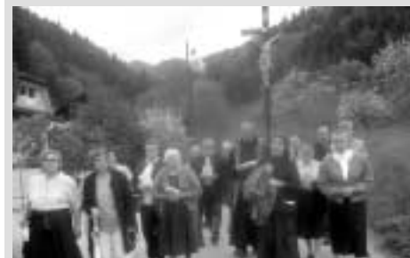
Bittprozession in Laufnitzdorf