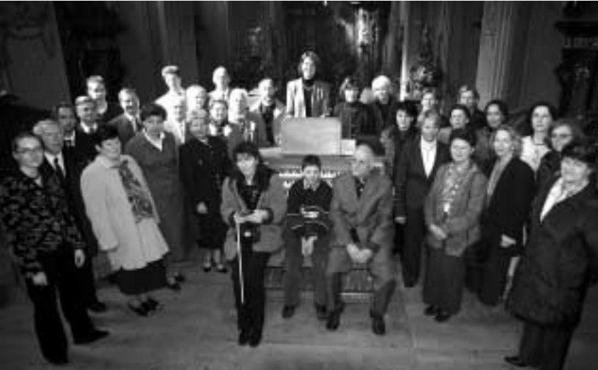
Chor der Pfarrkirche Frohnleiten