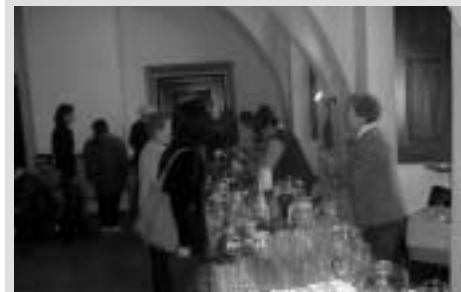
Flohmarkt der katholischen Frauenbewegung